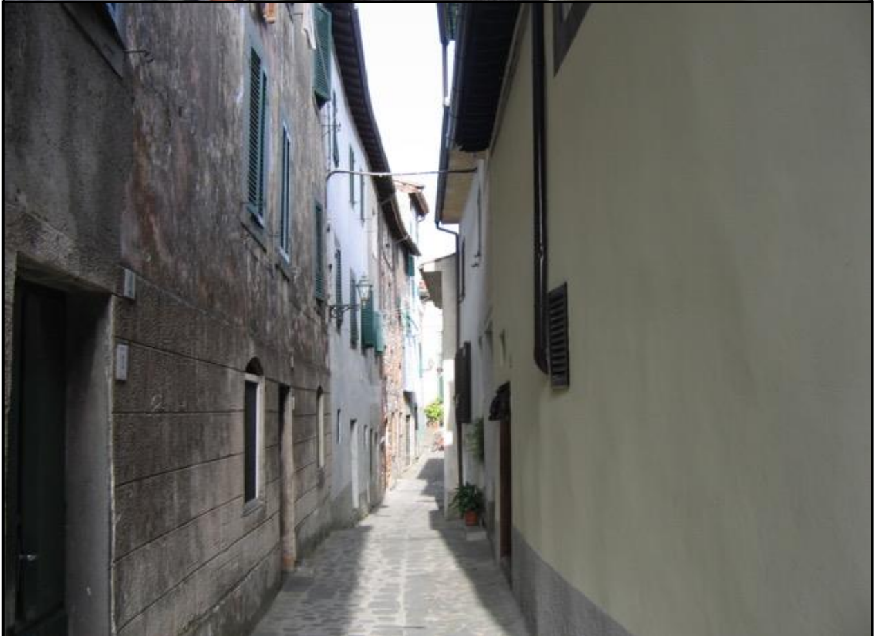
Dal Piantaio partiva anche la mulattiera di Marceglio, che passava larga dal paese sul 2008 13