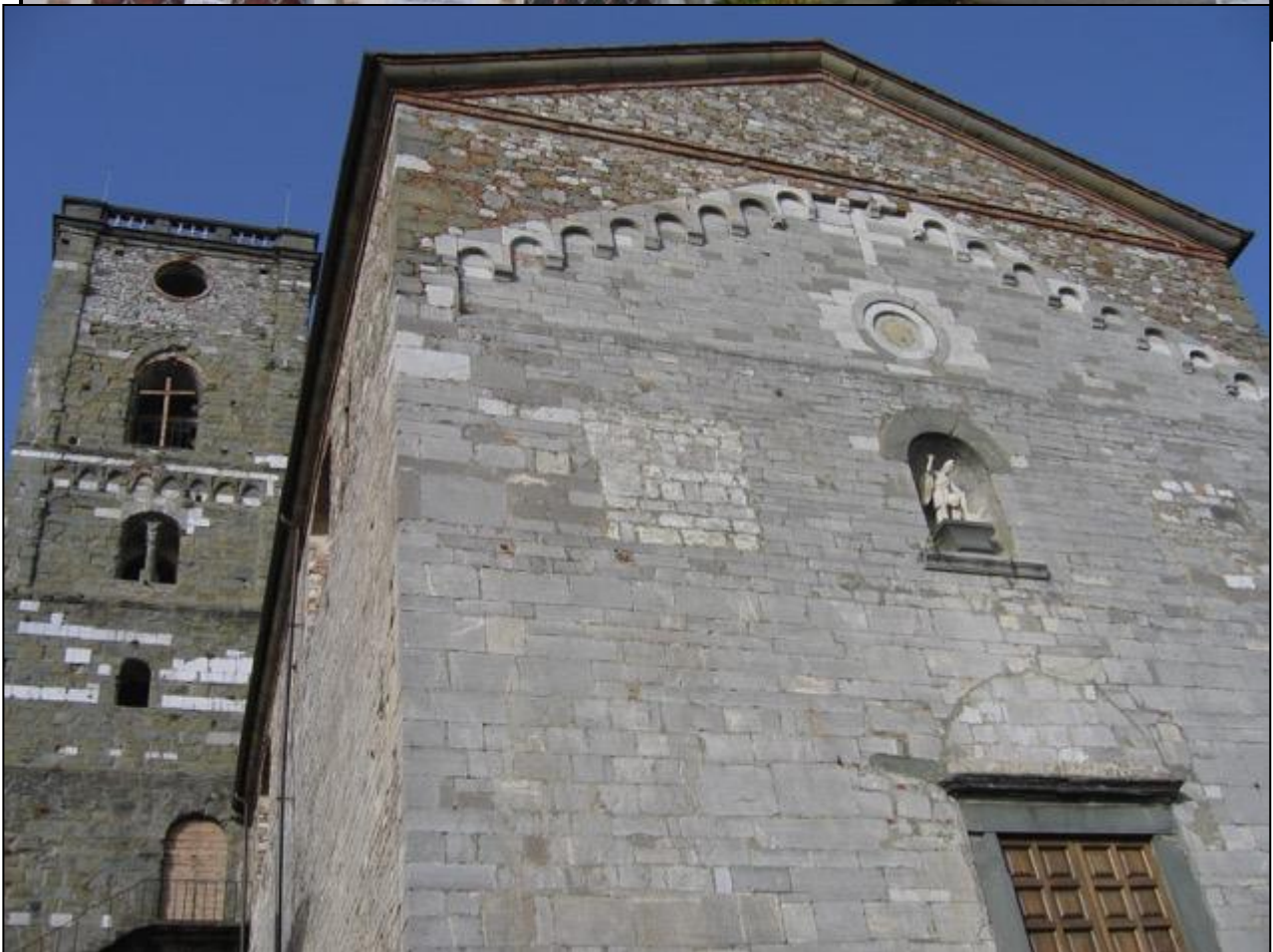
Nella casa a destra del Comune abita l'Elvira, figlia di Guidone e di Nella e sorella d 2008 13