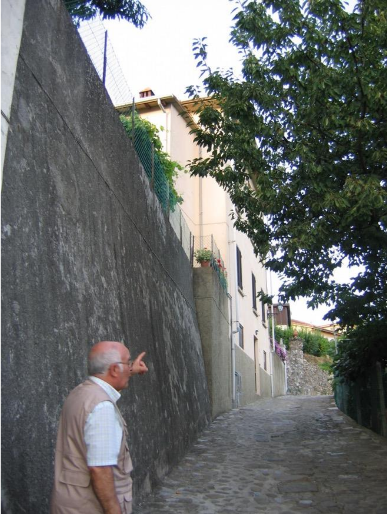
figura antitetica rispetto al nome, pareva una presa in giro inamovibile. Piccolo, molto