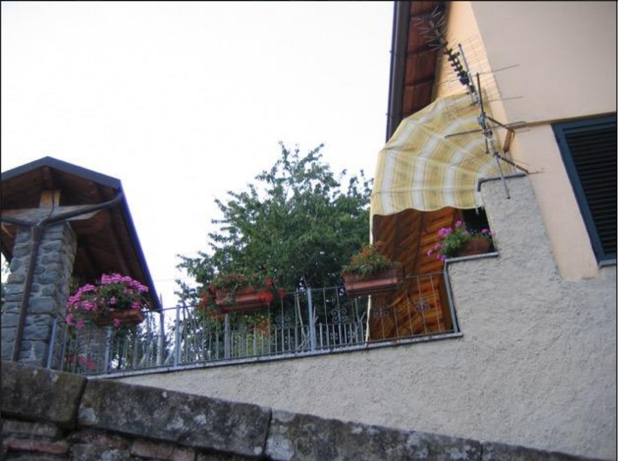
A Porta a Ponte inizia, in discesa, la via del Forte . Immediatamente a destra oggi 2008 13