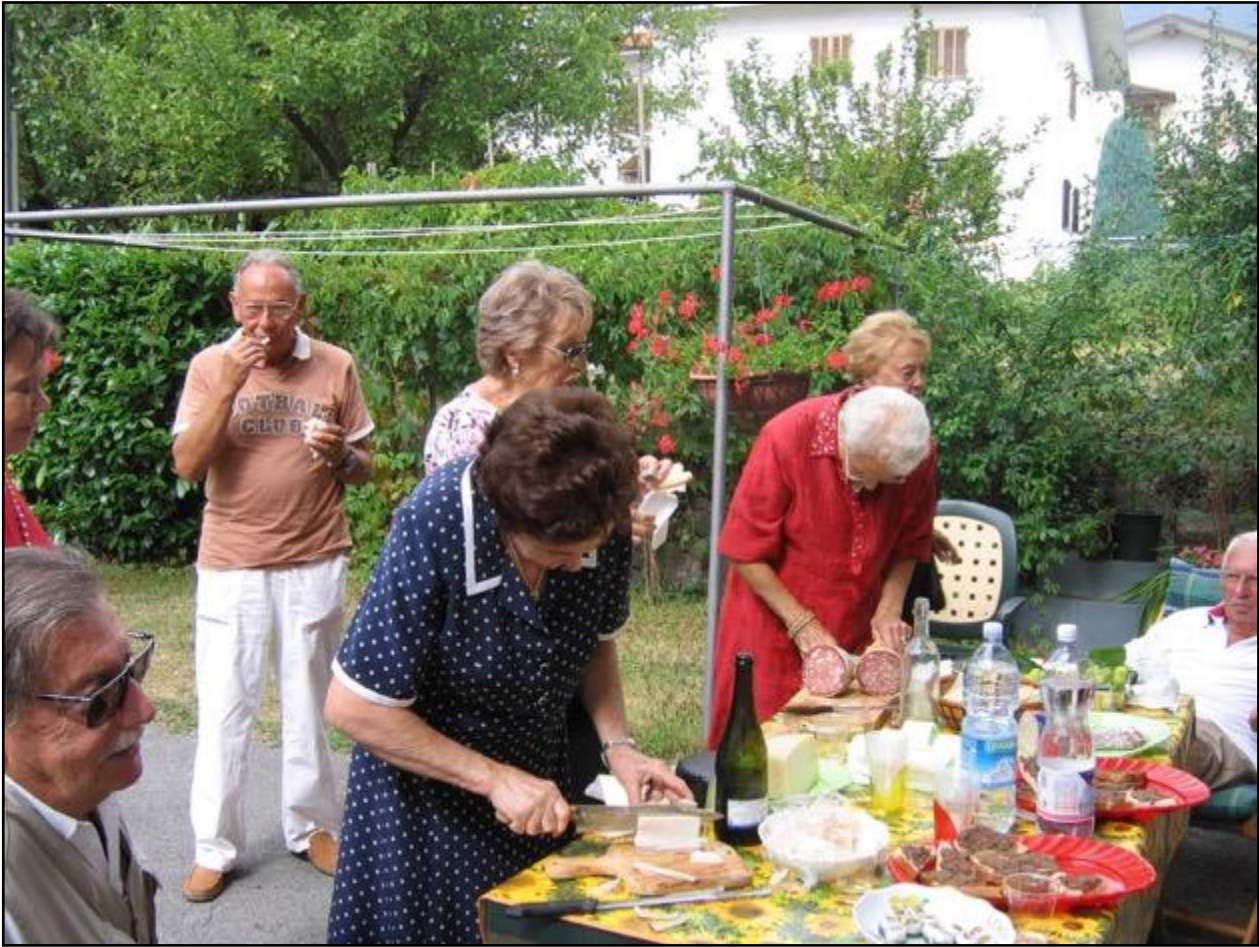
Sveglia alle 7,30. Tutto il giorno a Maresca dal Tacchi. Siamo andati su con i