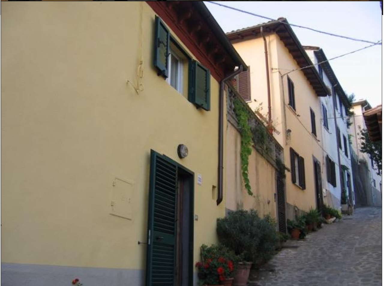
Arriviamo alla casa di Ercole e Renato, il figlio mio coetaneo. Ercole, tipica 2008 13