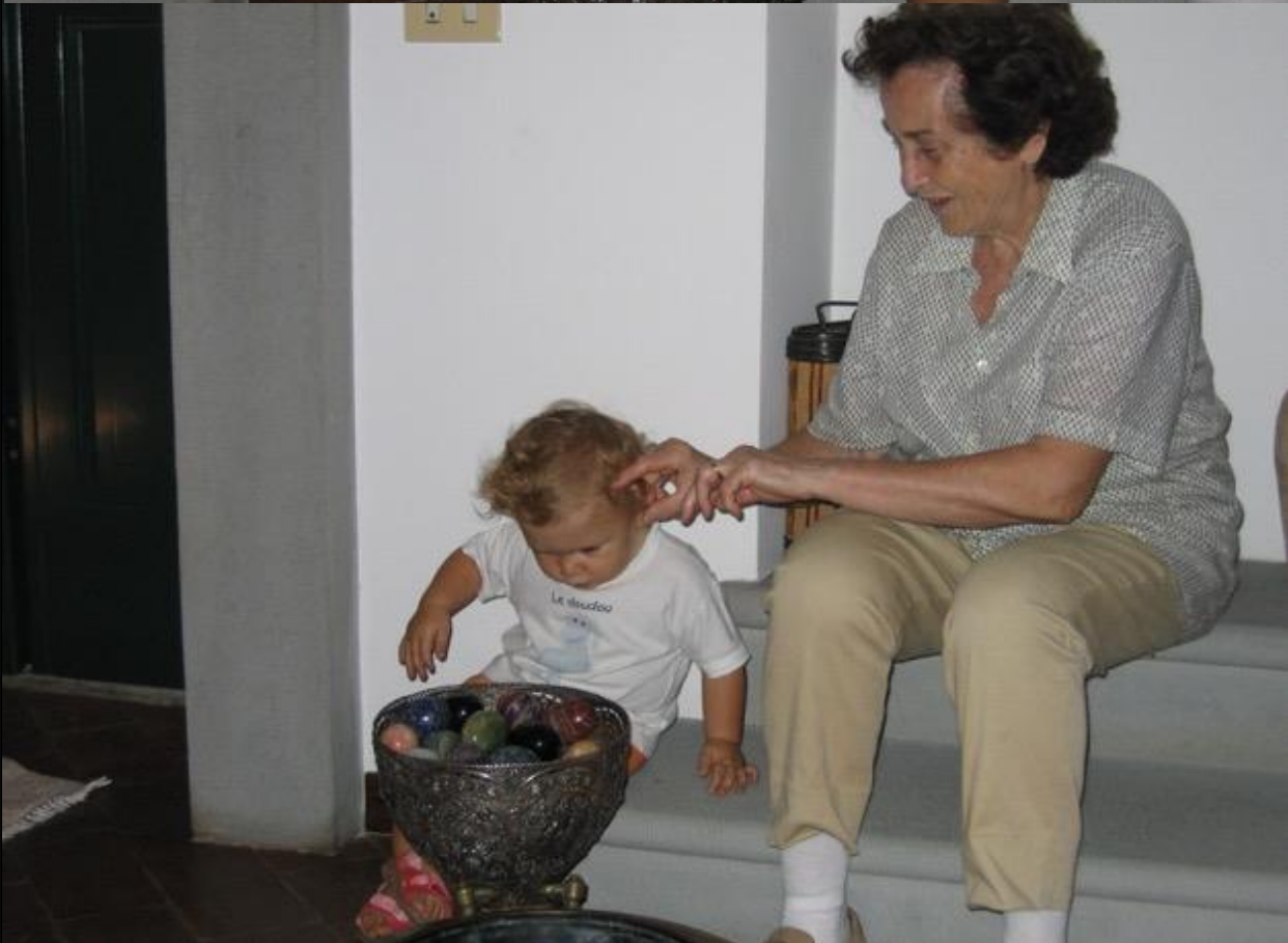
Cercato Nacci mi ha chiuso.